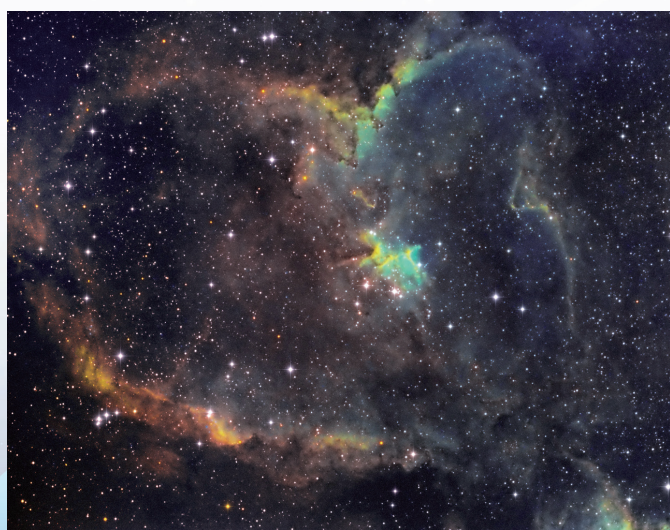
1805 (英仙座心臟星雲 SHO版)